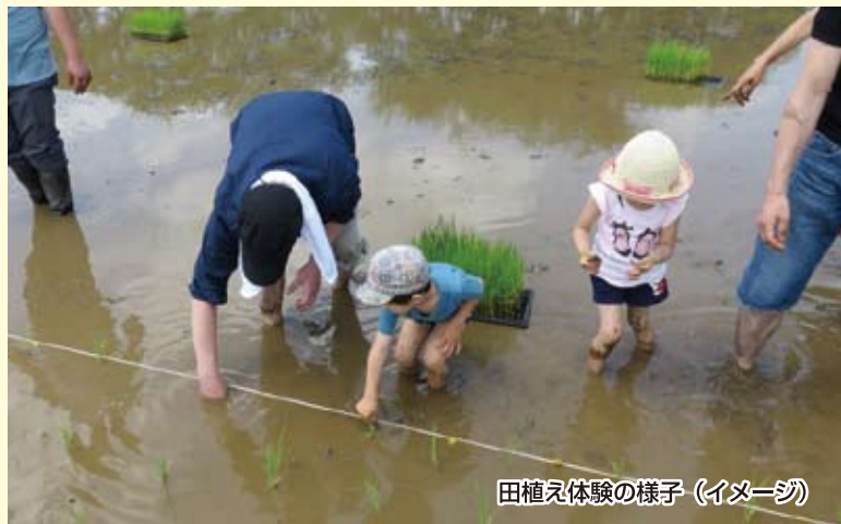
田植え体験の様子 (イメージ)