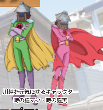
川越を元気にするキャラクター 時の鐘マシ・時の鐘美